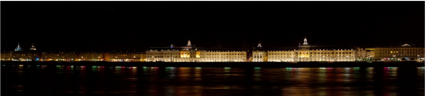
Vue des quais depuis la rive droite.

Bordeaux est la principale ville du sud-ouest de la France. Historiquement sa capitale, le commerce des productions agricoles de cette région — dont ses vins fameux dans le monde entier — en a fait un lieu d'échange, de brassage et de métissage. Port de commerce très actif, son passé historique lui vaut une architecture classique née du remaniement de la ville à partir du XVII e siècle. C'est d'ailleurs la qualité de ce legs architectural qui a valu à Bordeaux, Port de la Lune d'être inscrite par l'UNESCO au Patrimoine mondial de l'humanité 9 .