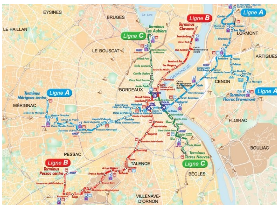
Plan des lignes de tramway

La ligne B du tramway permet aux participants de profiter de la ville, de ses restaurants le soir en semaine ou de rejoindre l'emplacement des Rencontres Mondiales à Bordeaux centre durant le week-end des 10 et 11 juillet 2010.