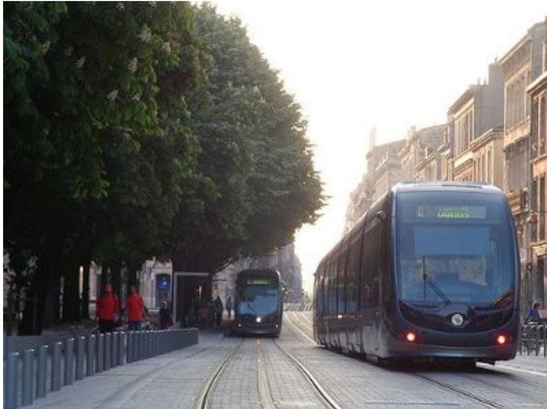
Tramway, place Pey Berland.

Son histoire n'a pas empêché la ville de vivre dans son temps. Des quartiers modernes ont vu le jour au cours des dernières décennies (Mériadeck, Le Lac) et plus récemment (Queyries). Le réseau de transport en commun, modernisé, a également fortement influencé l'urbanisme. Le tout nouveau tramway a suscité la remise en état de très nombreuses rues et façades, qui retrouvent aujourd'hui toute la luminosité de leurs pierres blondes. La façade des quais du « Port de la Lune », désormais superbement mise en valeur, est un panorama qu'il faut avoir vu sous le soleil levant d'une calme journée de début d'été. Les quais se sont débarrassés des restes d'infrastructures portuaires et des voitures qui les encombraient et se sont transformés en une promenade longue de plusieurs kilomètres, fort appréciée des citadins et des touristes.